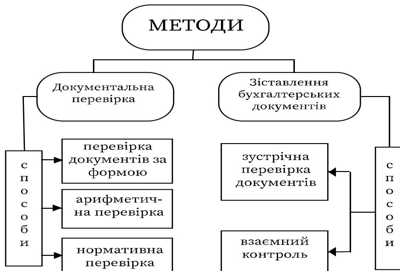
Схема 2. Методи та способи, що застосовуються під час дослідження операцій із нарахування та виплати заробітної плати

При цьому експертом застосовуються такі методичні прийоми: документальна перевірка (перевірка документів за формою, арифметична й нормативна перевірка) та зіставлення документів (схема 2).